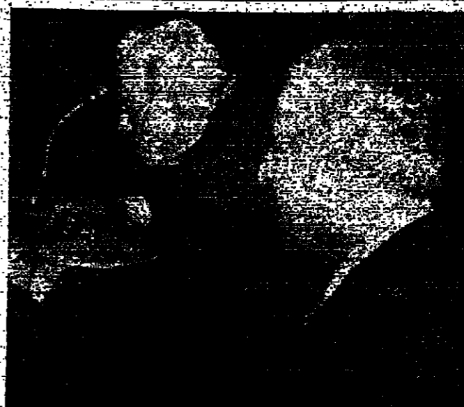
تشمعون يتحدث كرامي يسمع